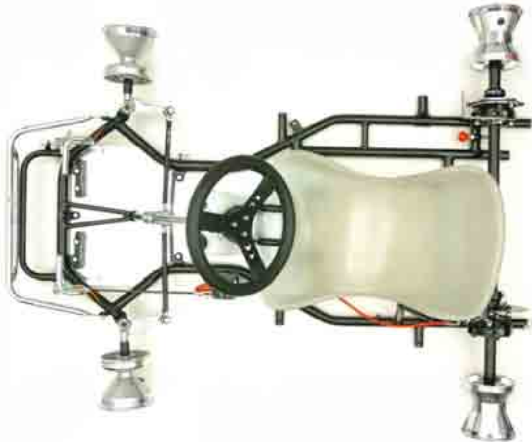
FOTO DEL TELAIO COMPLETO IDENTICO AD UNO DEI MODELLI PRESENTATI ALL'ISPEZIONE, SENZA CARROZZERIE E SENZA PNEUMATICI